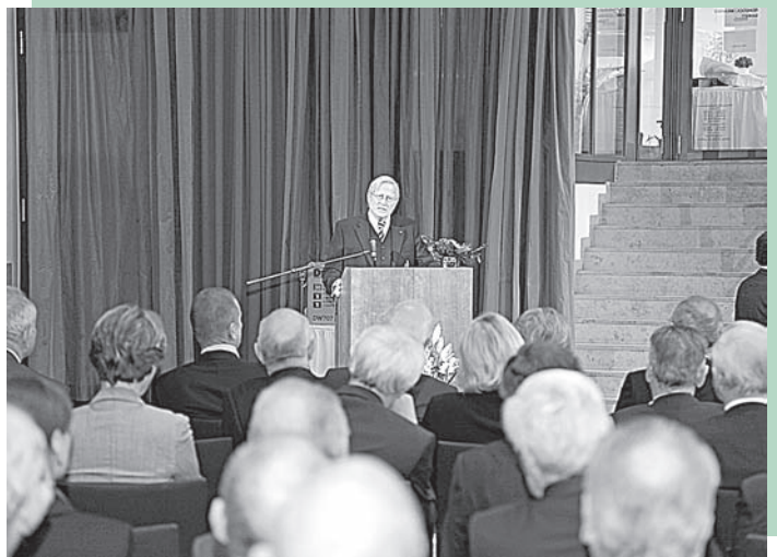
Dank JR Dr. Westenbergers

Europa nahm und nimmt immer mehr Einfluss auf die nationalen