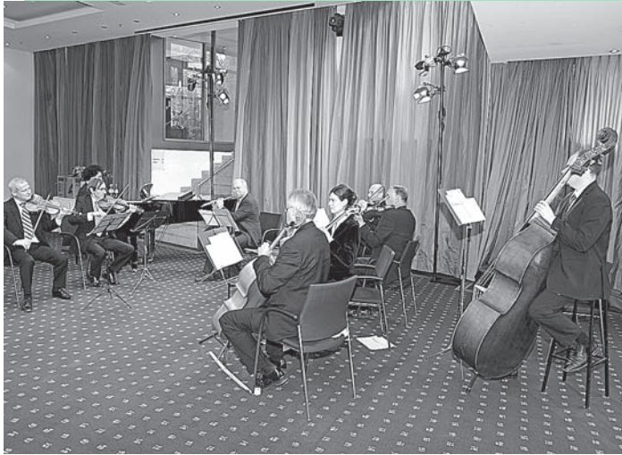
Das Salonensemble der RAK-Koblenz „I Sündici“